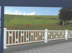
금속제 기타 울타리